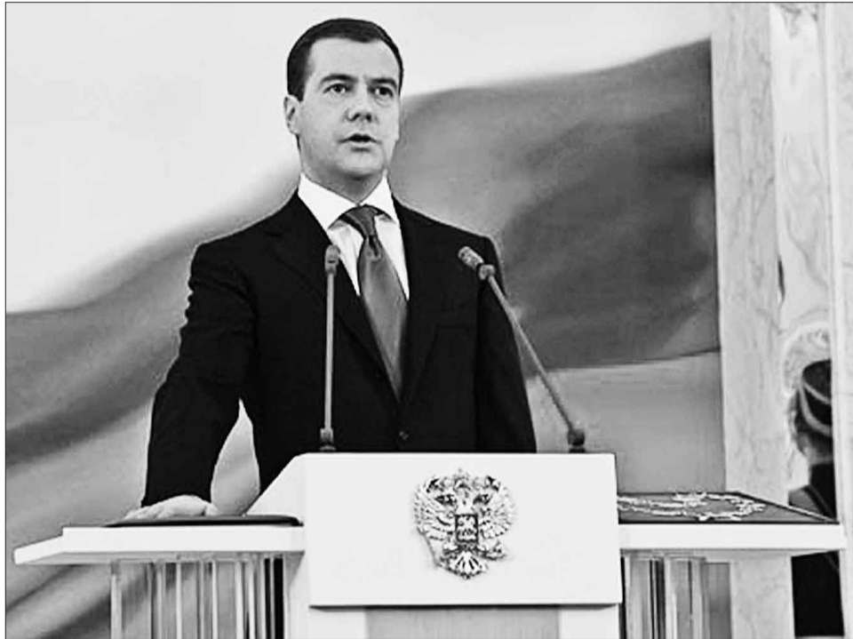
Инаугурация Д.А. Медведева 7 мая 2008 года.

В период после проведения выборов президента России в 2004 году и до назначения даты выборов президента России в 2007 году был существенно изменен Федеральный закон «Об основных гарантиях из-